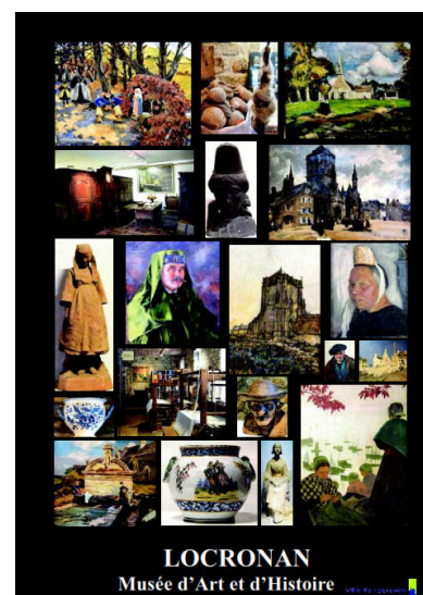
LOCRONAN Musée d'Art et d'Histoire

Lors de la dernière réunion à la mairie le 15 juin dernier, il a été décidé d'organiser une assemblée générale fin septembre, la date sera ultérieurement communiquée.