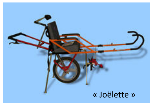
« Joëlette »

Si ce projet vous intéresse (organisation, participation ...), vous pouvez contacter la mairie. Nous avons la chance, pour ce projet, de bénéficier d'une cagnotte offerte par la municipalité et les associations de Locronan, bénéfice de la buvette de la Saint Jean !