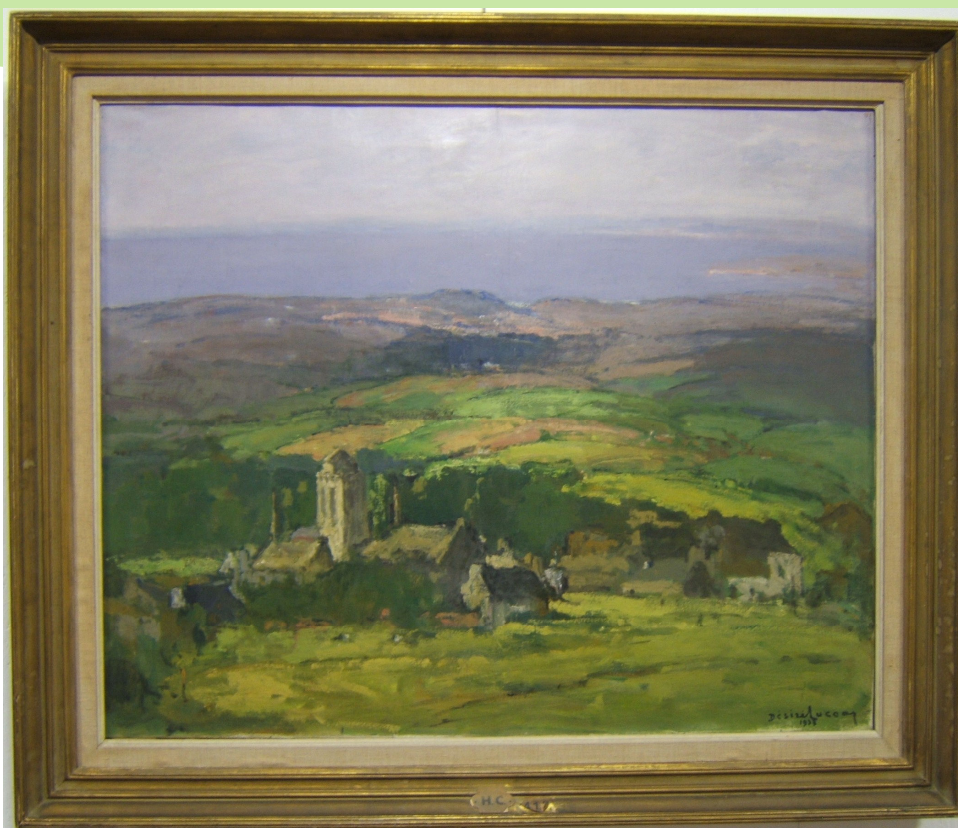
Les Hauteurs de Locronan, 1937, huile sur toile, 81x100 cm

Dans son livre autobiographique « Notes et Souvenirs » qu'il rédige en 1938, quelques mois après le décès de son épouse, on remarque la reproduction de cette œuvre en noir et blanc qui reflète l'aboutissement de ses recherches et qu'il définit ainsi : « Qu'est ce qu'un tableau ? Une émotion reçue et transmise. Voici la voûte insondable du ciel. La terre prend sa place sous cet infini, la lumière nous révèle la structure ; dans l'espace, ses lignes et ses mouvements forment une succession de plans qui se colorent selon l'heure et la distance. Aucun de ces plans n'échappe à l'influence du ciel et chacun exerce une action sur ses voisins ».