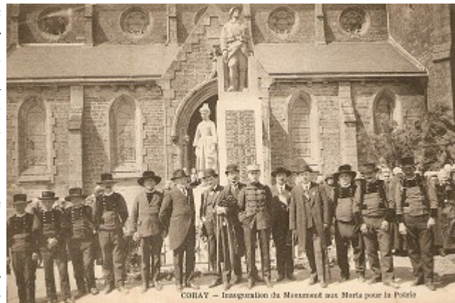
COHAY - Inauguration du Monument aux Morts pour la Patrie