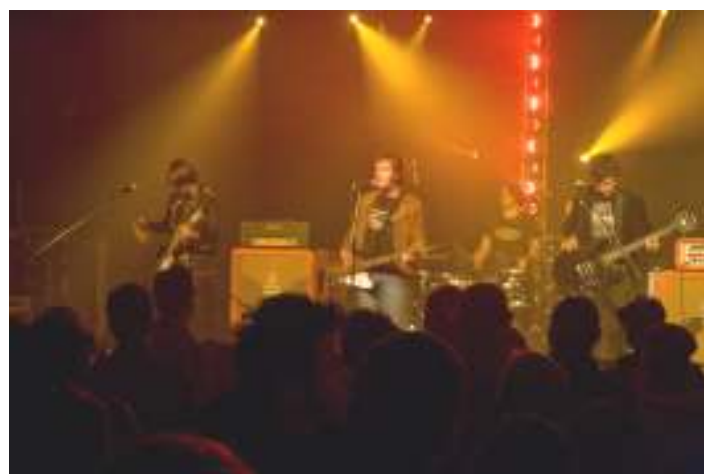
Le concert rock du 30 novembre

Les associations voudront bien, adresser à la mairie avant la fin janvier, leur demande de subvention. La demande doit s'accompagner du bilan financier de 2010 et des projets de 2011.