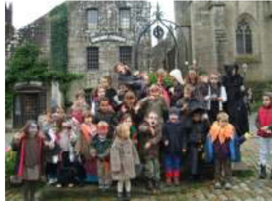
C'est Halloween, encore une belle occasion de se déguiser !