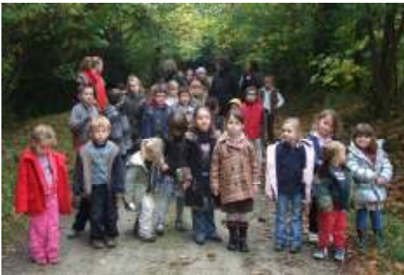
En promenade à Gouesnac'h au Ty Théâtre