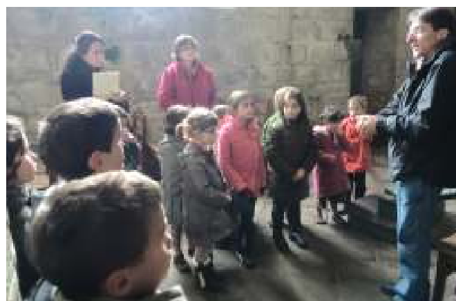
A l'église, à partir des médaillons de la chaire les plus jeunes apprennent l'histoire de Saint Ronan.