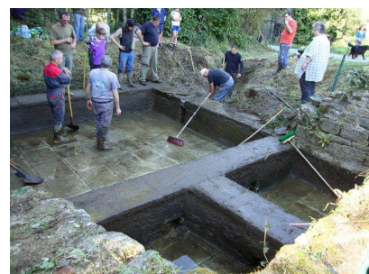
Travaux en cours au lavoir de Kerjacob ,