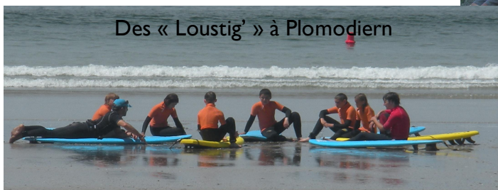
Des « Loustig' » à Plomodiern