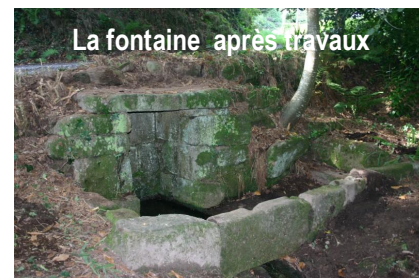
La fontaine après travaux