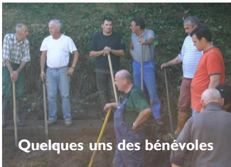
Quelques uns des bénévoles